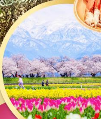
สวนอาซาฮิฟุเนะคาวะ