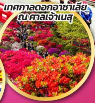
เทศกาลดอกอาซาเลีย ณ ศาลเจ้าเนสุ