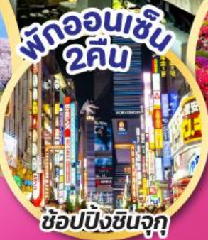
พักออนเซ็น 2 คืน