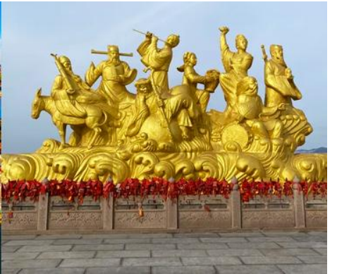
อุทยานท่งเที่ยวแปดเซียนข้ามทะเล