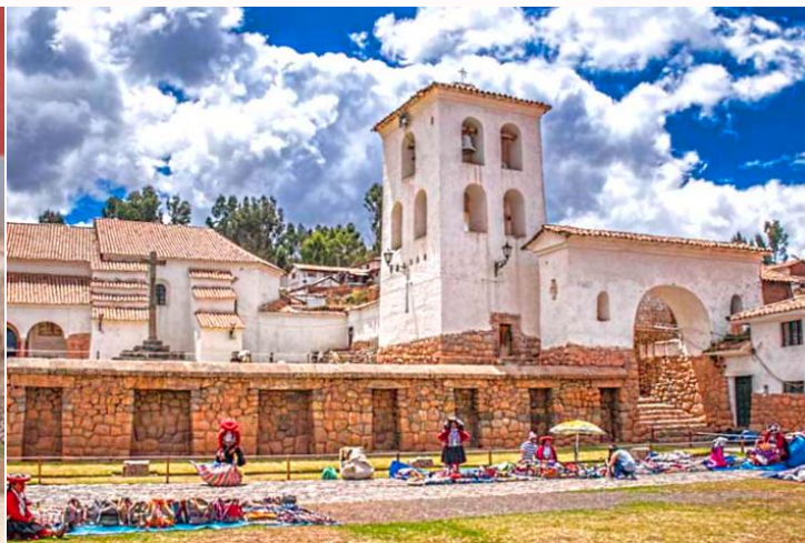
เที่ยง บริการอาหารกลางวัน ณ ภัตตาคาร Hanka Restaurant