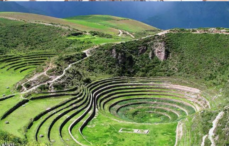
บ่าย นำท่านเดินทางสู่ มาราซ (Maras) แหล่งผลิตเกลือที่คุณภาพดีที่สุดในโลก ที่มีมาตั้งแต่สมัยอินคา แนวนาชั้นบันไดที่เรียงอยู่ตามลำดับความสูงของภูเขา จากนั้นเดินทางสู่ โมเรย์ (Moray) นาชั้นบนโดวงกลมขนาดใหญ่หลายๆรูปร่างแปลกตาที่ชาวอินคาทำไว้เพื่อทดลองปลูกพืชพันธุ์ต่างๆ จากจุดนี้สามารถมองเห็น หมู่บ้านอูรัมบัмба (Urubamba) ได้อีกด้วย ได้เวลาเดินทางกลับสู่เมือง เมืองคัสโก (Cusco) เมืองหลวงของอาณาจักรอินคา ที่แพร่ขยายอำนาจจนกินพื้นที่ 1 ใน 3 ของอเมริกาใต้ ตั้งอยู่เหนือระดับน้ำทะเลถึง 3,400 เมตร และเป็นแหล่งอารยธรรมยุคก่อนประวัติศาสตร์ที่ลึกลับน่าทึ่ง เป็นชุมชนเก่าแก่ของจักรวรรดิอินคาอันรุ่งเรือง ซึ่งยังคงทิ้งร่องรอยความเจริญไว้ให้เห็นเป็นซากปรักหักพังโบราณและโบราณวัตถุต่างๆ