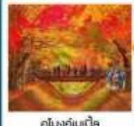
อุโมงค์เมนิค