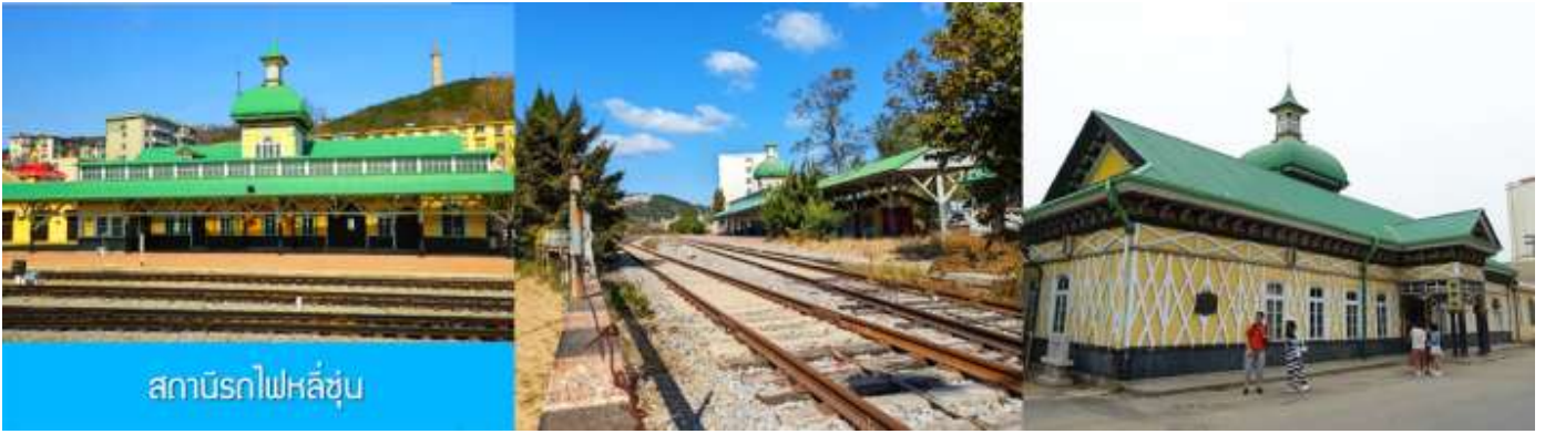
สถานีรถไฟหลี่ซุ่น

นำท่านเที่ยวชมและเก็บภาพ ณ สถานีรถไฟหลี่ซุ่น 旅顺火车站 เป็นสถานีปลายทางของเส้นทางรถไฟสาขา เลิ่นหยาง - ต้าเหลียน สร้างขึ้นในปีค.ศ. 1903 ออกแบบโดยสถาปนิกชาวรัสเซีย เป็นอาคารอิฐก่อปูนผสม โครงสร้างไม้ตามสถาปัตยกรรมรัสเซีย.