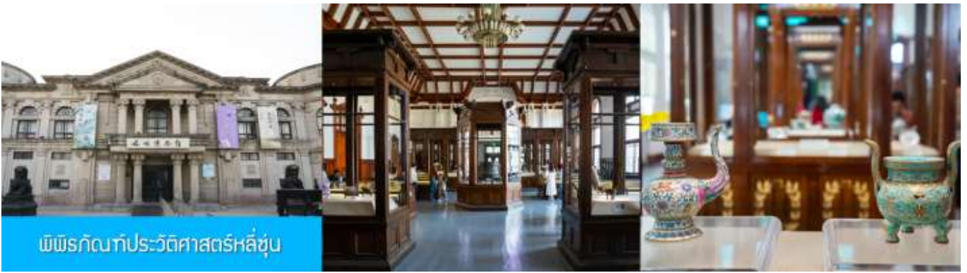
พิพิธภัณฑ์ประวัติศาสตร์หลี่ซุ่น

นำท่านเที่ยวชมและเก็บภาพ ณ สถานีรถไฟหลี่ซุ่น 旅顺火车站 เป็นสถานีปลายทางของเส้นทางรถไฟสาขา เลิ่นหยาง - ต้าเหลียน สร้างขึ้นในปีค.ศ. 1903 ออกแบบโดยสถาปนิกชาวรัสเซีย เป็นอาคารอิฐก่อปูนผสม โครงสร้างไม้ตามสถาปัตยกรรมรัสเซีย.