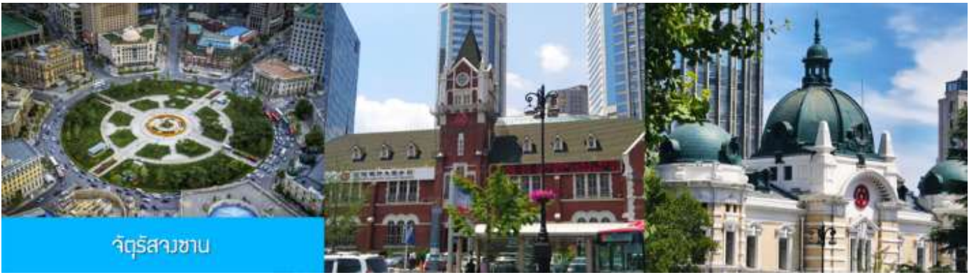
จัตุรัสสวน