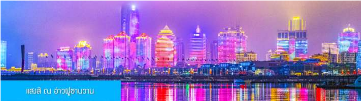
แสงสี ณ อ่าวฟู่ซานวาน

หลังอาหารนำท่านชมความอลังการของแสงสี ณ อ่าวฟู่ซานวาน 浮山湾灯光秀 ชมความอลังการของแสงสียามหัวค่ำ และไฟที่เต้นระบำได้บนตึกสูง และเป็นหนึ่งในไนท์วิวที่สวยงามที่สุดแห่งหนึ่งของจีน..... พักที่ JIFENG INTER HOTEL โรงแรมระดับ 4 ดาวท้องถิ่น ในเมืองเมืองชิงเต่า