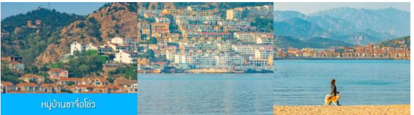
หมู่บ้านซาจื่อโจ้ว

เช้า รับประทานอาหารเช้า ณ ห้องอาหารของโรงแรม (4)