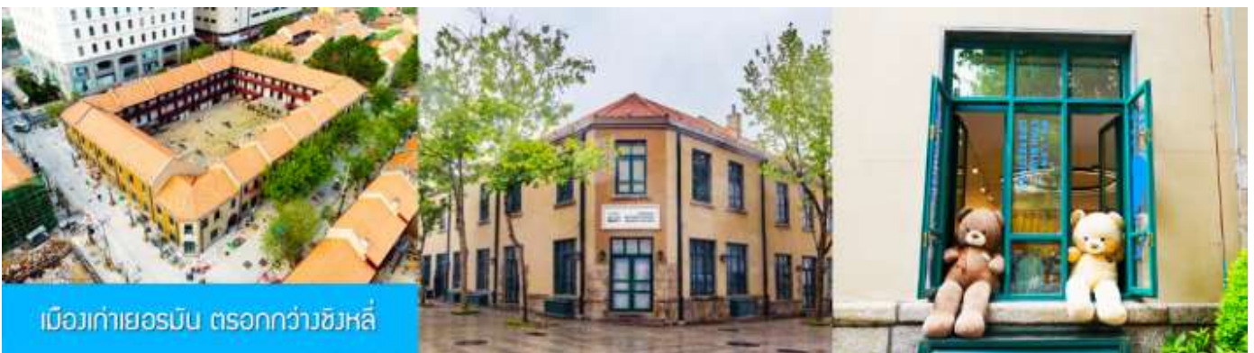
เมืองเก่าเยอรมัน ตรอกกว้างชิงหลี่

จากนั้นนำท่านเดินเที่ยวชม ถนนจงซาน 中山路 ถนนที่เต็มไปด้วยกลิ่นอายยุโรป และถนนสายนี้มีบันทึกรื่องราวมากกว่าศตวรรษของเมืองชิงเต่าไว้ ที่นี่เป็นศูนย์กลางการค้าแห่งแรกที่เต็มไปด้วยสถาปัตยกรรมสไตล์ยุโรปเก่าแก่ที่ได้รับอิทธิพลมาจากเยอรมัน ให้ท่านได้เดินเก็บบรรยากาศ และ เก็บภาพกับโบสถ์เซนต์ไมเคิล (ด้านนอก) โบสถ์แห่งนี้ที่คู่รักนิยมมาถ่ายภาพงานแต่งงานกันมากที่สุดในเมืองชิงเต่า ให้ท่านถ่ายรูปเก็บภาพ