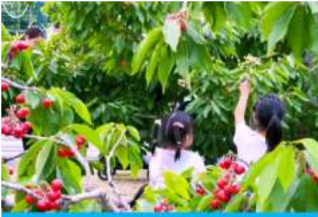
สวนเชอร์รี่