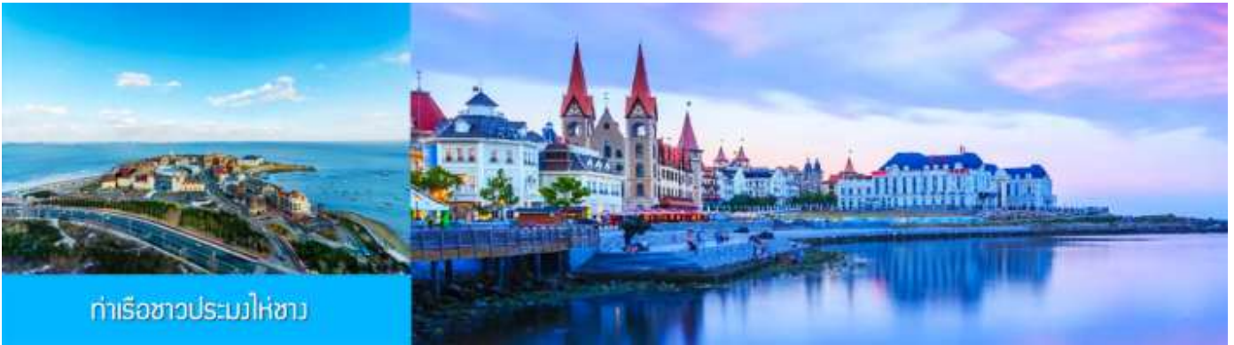
ท่าเรือชาวประมงไห่ซาง