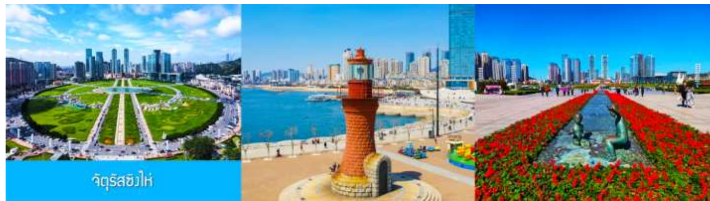
จัตุรัสฮวิ่

จากนั้นนำท่านเที่ยวชมและเก็บภาพ ณ พิพิธภัณฑ์ประวัติศาสตร์หลี่ซุ่น 旅顺博物馆 เป็นอาคารพิพิธภัณฑ์เก่าแก่อายุกว่าร้อยปีแห่งแรกที่สร้างขึ้นทางภาคตะวันออกเฉียงเหนือของจีน อาคารพิพิธภัณฑ์มีความโดดเด่นด้วยสถาปัตยกรรมแบบกรีกโรมันยุคเรเนซองส์ ผสมผสานสถาปัตยกรรมแบบตะวันออก ภายในมีการจัดแสดงโบราณวัตถุกว่า 60,000 ชิ้น ท่านสามารถเก็บภาพที่ระลึกด้านหน้าอาคารพิพิธภัณฑ์ และสามารถเข้าชมโบราณวัตถุภายในพิพิธภัณฑ์ได้ตามอัธยาศัย (พิพิธภัณฑ์ปิดทุกวันจันทร์)..