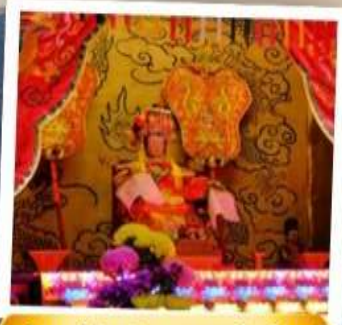
เจ้าแม่ทับทิม จอสเฮ้าส์เบย์