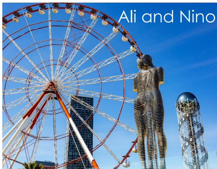
Ali and Nino

จากนั้นนำท่านสู่ถนนเลียบชายหาดบาตูมิ (Batumi Promenade) ถนนเลียบชายหาดที่ยาวถึง 6 กิโลเมตร สร้างขึ้นตั้งแต่ปี ค.ศ. 1884 ประดับด้วยน้ำพุงดงามตลอดสาย และเป็นถนนที่ยาวที่สุดบนชายหาดทะเลดำ ทิศนียภาพผสมผสานวิวภูเขาและวิวทะเล นำชมแลนด์มาร์คสำคัญๆ ตลอดถนน ชมอนุสาวรีย์อาลีและนีโน (Ali and Nino Monument) เป็นสถาปัตยกรรมโลหะสมัยใหม่ ทำด้วยเหล็ก เคลื่อนไหวได้ ความสูงประมาณ 8 เมตร ผลงานศิลปินชาวจอร์เจีย Tamara Kvesitadze ที่บอกเล่าเรื่องราวความรักและความเศร้าของ อาลี หม่อมมุสลิม กับเจ้าหญิงนีโน แห่งจอร์เจีย หลังจากถูกกองทัพโซเวียตรุกราน จากวรรณกรรมของนักเขียนชาวอาเซอร์ไบจาน นอกจากนี้ยังมีความพิเศษคือรูปปั้นนี้ จะขยับเข้าหากันในเวลา 19.00 น.ของทุกวัน ถ่ายรูปกับ หอคอยซิงซ์ซ่าสวรรค์ (Alphabetic Tower) ที่ตั้งริมทะเล