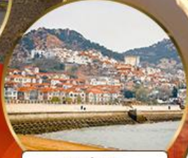
ซาจี้โข่ว