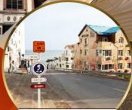
ถนนอ่าวจีป่า