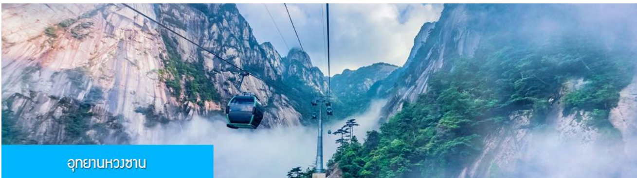
อุทยานหวงชาน