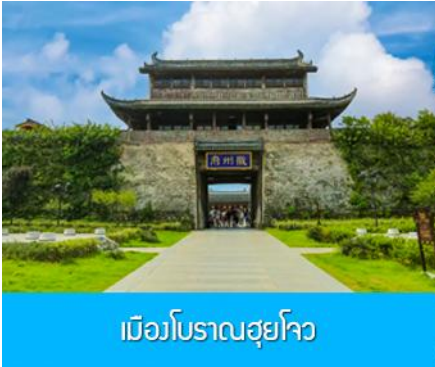
เมืองโบราณฮุยโจว