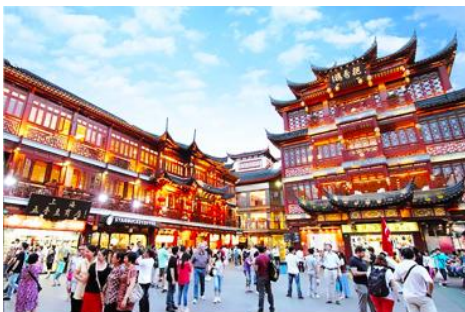
ตลาดเจิงหวงเมี่ยว

เช้า รับประทานอาหารเช้า ณ ห้องอาหารของโรงแรม (6)