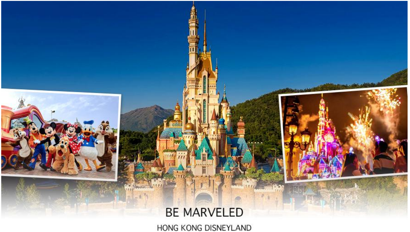
BE MARVELED HONG KONG DISNEYLAND

TIONS 2 กระเช้านงปิง 360 องศา ไหว้พระใหญ่เทียนถานกระเช้าลอยฟ้าองปิง (NGONG PING SKYRAIL 360 **STANDARD CABIN** มีระยะทางกว่า 5.7 กิโลเมตร ใช้เวลาประมาณ 25 นาที ท่านจะได้สัมผัสบรรยากาศจากบนกระเช้ามุมสูง เส้นทางกระเช้าเชื่อมจากใจกลางเมืองตงซุง ถึง หมู่บ้านวัฒนธรรมนงปิง บนเกาะลันเตา ท่านจะได้ชมวิวแบบพาโนรามา 360 องศา ของสนามบินนานาชาติฮ่องกง ทิวทัศน์เหนือท้องทะเลของทะเลจีนใต้ ชมวิวของเนินเขาอันเขียวขจี น้ำตก ลำธาร และป่าอันเขียวชอุ่มของอุทยานบนเกาะลันเตาเหนือ ถือได้ว่าเป็นแหล่งท่องเที่ยวอันมีเอกลักษณ์ระดับโลกของฮ่องกง ( **กรณีกระเช้านงปิง 360 มีการปิดซ่อมบำรุง หรือ มีการปิดเนื่องจากสภาพอากาศแปรปรวน ทางบริษัทฯ ขอสงวนสิทธิ์ในการเปลี่ยนเป็นใช้รถโค้ชของทางอุทยานในการเดินทาง เพื่อนำท่านขึ้นสู่หมู่บ้านวัฒนธรรมนงปิง บนเกาะลันเตาแทน** ) จากนั้นนำท่านไปสักการะ (พระใหญ่เกาะลันเตา หรือ พระพุทธรูปเทียนถาน (TIAN TAN BUDDHA STATUE)