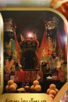
วัดบ้านใหม่