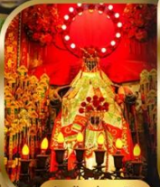
เจ้าแม่กวนอิม ฮ่องฮ่า