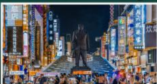
ถนนแดนเดินแดงซิงซู