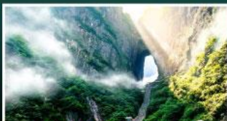
เขาประตูลสวรรค์