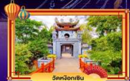
วัดผิงอเกิน