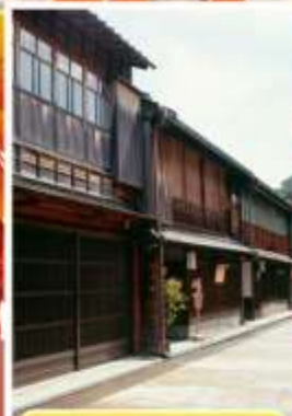
ย่านอิงาชิซายะ