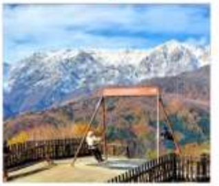
ฮาคูนะอิวาทาเกะ