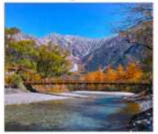
ดามิโดจิ