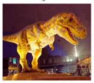
พิพิธภัณฑ์ไดโนเสาร์