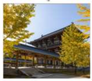
วัดไดชิซังเซอิโดจิ