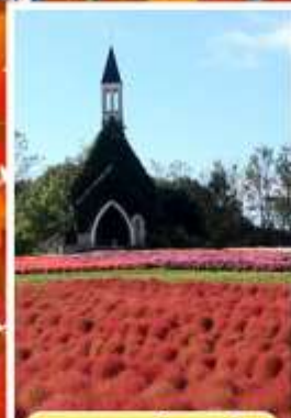
สวนบกกะโนะซาโตะ