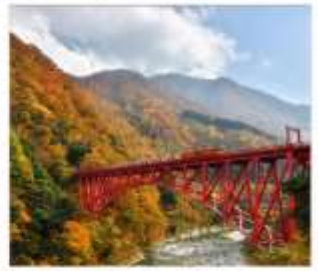
รถไฟชมวิวจุมนเขาคุโรมะ