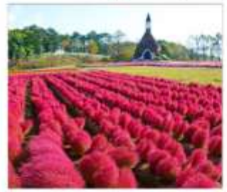
สวนดอกไม้มัมกคะโนะซาโตะ