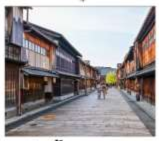
ย่านโรงน้ำชาอิงาชิบายะ