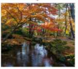
สวนเคนโระคุเซ็น