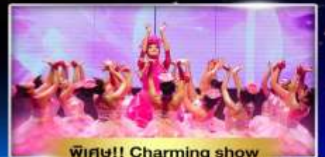
พิเศษ!! Charming show