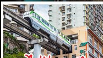
รถไฟไฟทะเลลู่ติ๊ก