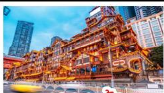
เฉิงเฉิงเฉิง

อุทยานหลุมบ่อฟ้า - อุทยานเขานางฟ้า หงหยาดัง - นังรถไฟทะเลลู่ติ๊ก - อุทยานสีดรุณี ปี้เฉิงโกว - สะพานหนานเฉียว