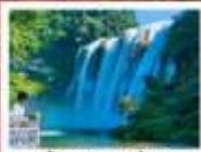
น้ำตกหวงกั๋วซู