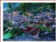
หมู่บ้านแม่วชิเจียง