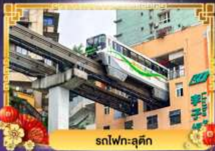
รถไฟฟ้าชุนชิ่ง