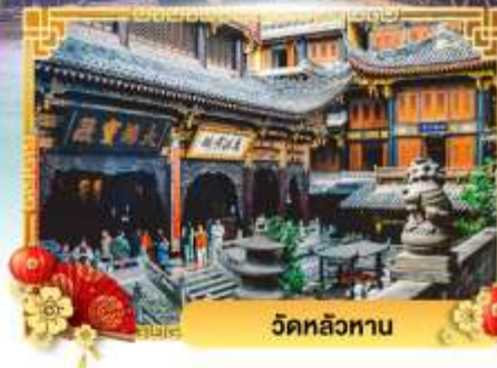
วัดหลัวหนาน