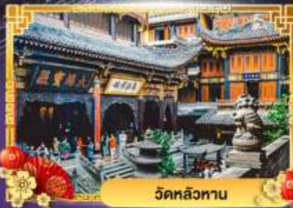
วัดหลิวทาน