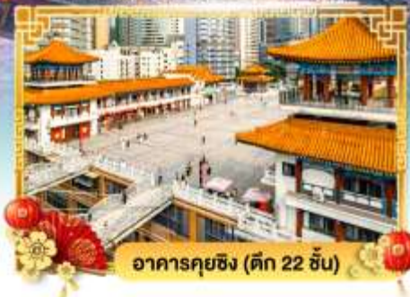
อาคารกุยชิง (ตึก 22 ชั้น)