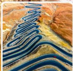
ถนนผานหลงกู่ต้าว