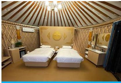
ห้องพักสไตล์มอโกเลียน