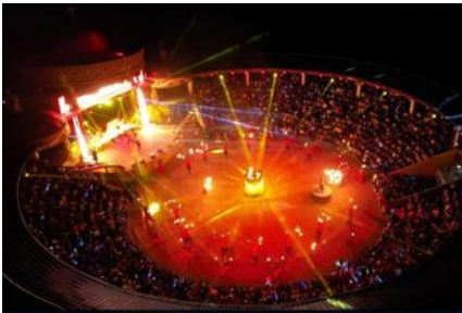
ปาร์ตี้กองไฟยามค่ำ