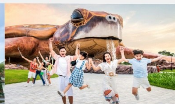
วินเพิร์ล อควาเรียม

*ทางบริษัทฯ ขอสงวนสิทธิ์ในการสลับโปรแกรมทัวร์ตามความเหมาะสมขึ้นอยู่กับสถานการณ์หน้างาน โดยคำนึงถึงผลประโยชน์ของลูกค้าเป็นสำคัญ