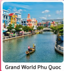
Grand World Phu Quoc