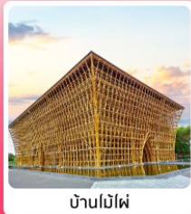
บ้านไม้ไผ่

ไอโกล์ เที่ยวครบ สวนน้ำ Aquatopia & สวนสนุก Vin Wonder เวนิสแห่งเวียดนาม Grand World Phu Quoc แลนด์มาร์คสุดโรแมนติก