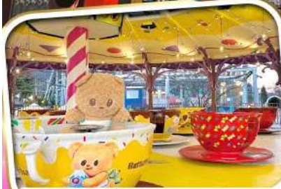
พลาดไม่ได้! BUTTERBEAR X FUJI-Q