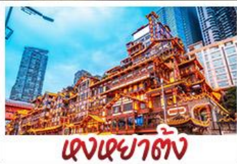
แสงเขย่าตึก