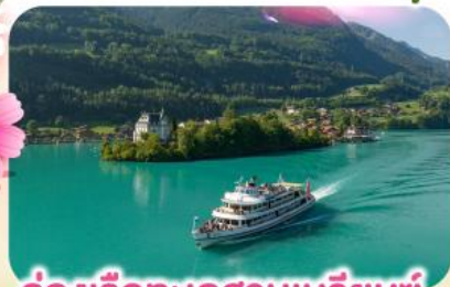
ล่องเรือทะเลสาบเบรียนซ์

พิชิตยอดเขาชุนเนกกา 1 ในเขาที่สวยงามที่สุดเมืองเซอร์แมท