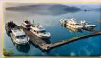
ล่องเรือชมทะเลสาบสุริยอินจินทรา