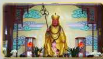
วัดพระกั๋งซำจั้ง