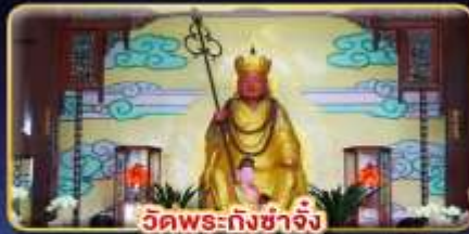
วัดพระกั๋งซาจิง