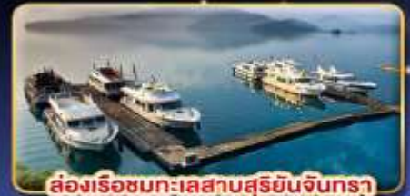
ต่องเรือชมทะเลสาบสุริยอันจินตรา