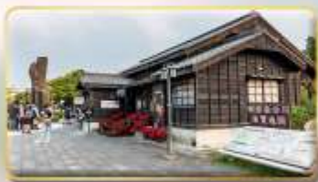
หมู่บ้านฮินกี้