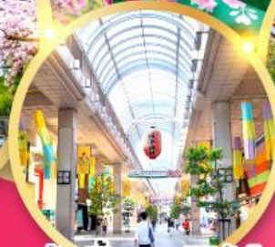
ช้อปปิ้ง ถนนอิชิบังโจ