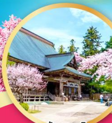
วัดชูซอนจิ