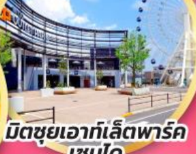
มิตซูเอากะเลียตพาร์ค เซนได