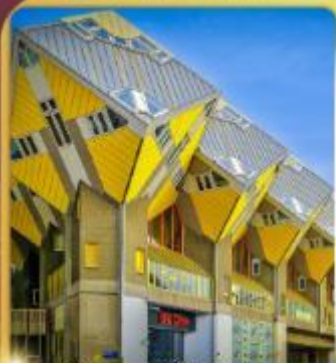
บ้านลูกเต่า โลกคู่บูส

“ล่องเรือหลังคากระจก” ชมกรุงอัมสเตอร์ดัม