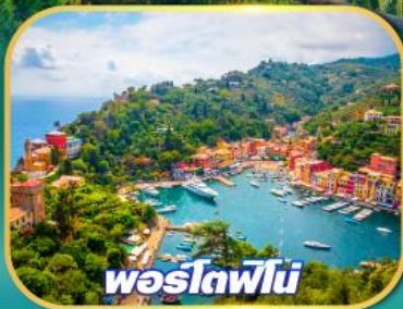
พอร์ตฟีโน