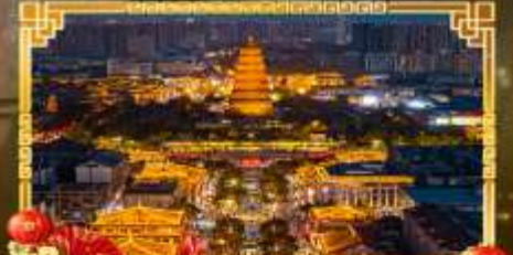
ถนนคนเดินราชวงศ์ถัง