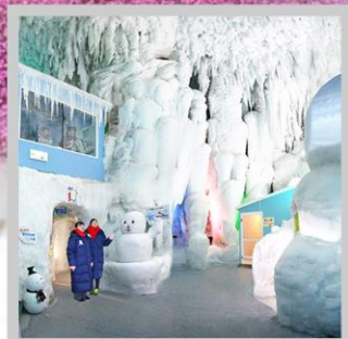
“KAMIKAWA ICE PAVILLION”