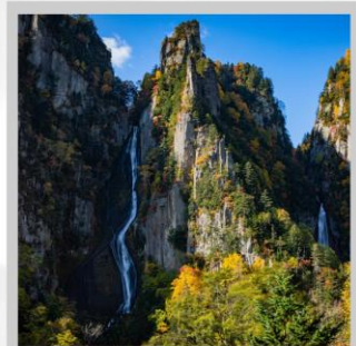
“GINGA & RYUSEI FALLS”

สัมผัสความสวยงามของดอกไม้ “ดอกทิวลิป ณ สวนคะมิยูเบตสึ” ที่มีมากกว่า 120 สายพันธุ์ เพลิดเพลินกับ “ถ้ำน้ำแข็งไอซ์ พาวริเลียน” ที่มีหยดน้ำแข็งรูปร่างสวยงามต่างๆ ที่อุณหภูมิ -20 องศา “ฟาร์มสุนัขจิ้งจอกฮอกไกโด” ฟาร์มสุนัขจิ้งจอกแห่งเดียวของเกาะฮอกไกโด สายพันธุ์ท้องถิ่นคือ สายพันธุ์ Ezo red fox ชมกระท่อมไม้หลังน้อยในดินแดนเทพนิยาย ณ “หมู่บ้านนิงเกิ้ลเทอร์เรซ” จำหน่ายสินค้าจำพวกงานฝีมือต่างๆ นำท่านขึ้นชมวิวมุมสูง “นั่งกระเช้าภูเขาไฟโมอิวะ” เพื่อชมทัศนียภาพของเมืองซัปโปโรจากมุมสูง ชม “ทุ่งดอกพืชมอส ณ สวนทาคิโนะอุเอะ” ด้วยพรมสีเขียวที่มีพื้นที่ขนาดใหญ่ถึง 100,000 ตารางเมตร