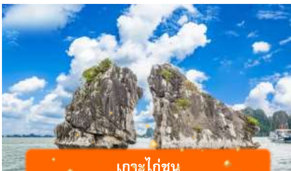
เกาะไก่อ๋น

เที่ยง บริการอาหารกลางวัน ณ ภัตตาคาร พิเศษ ... เมนูซีฟู้ดบนเรือ