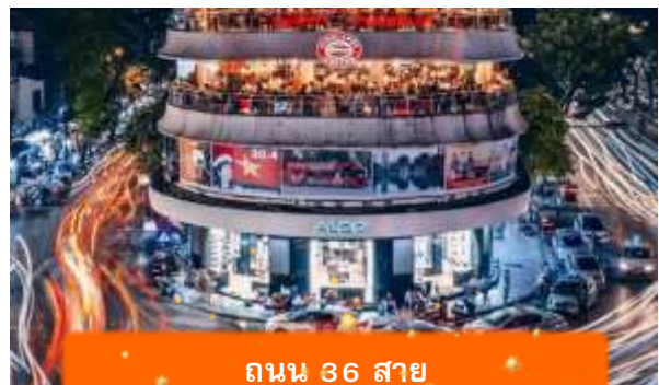
ถนน 36 สาย