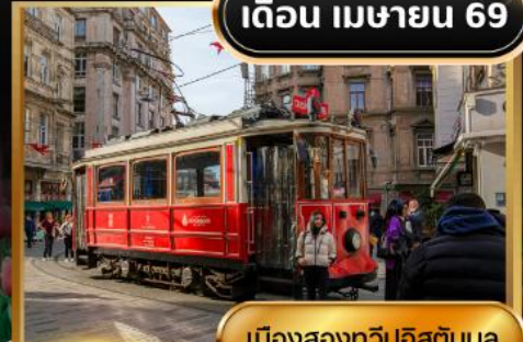
เมืองสองทวีปอิสตันบูล