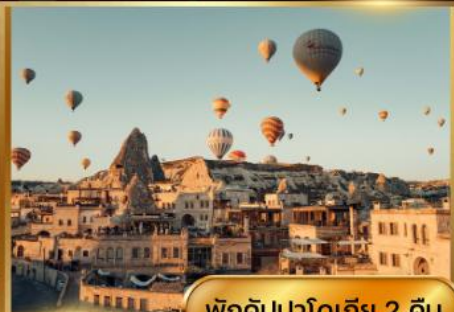
พิกคิปปาโดเกีย 2 คืน