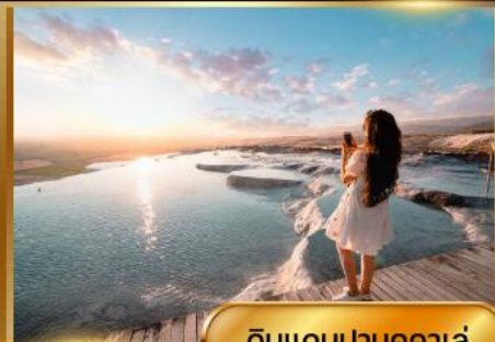
ดินแดนปามุคคาเล่