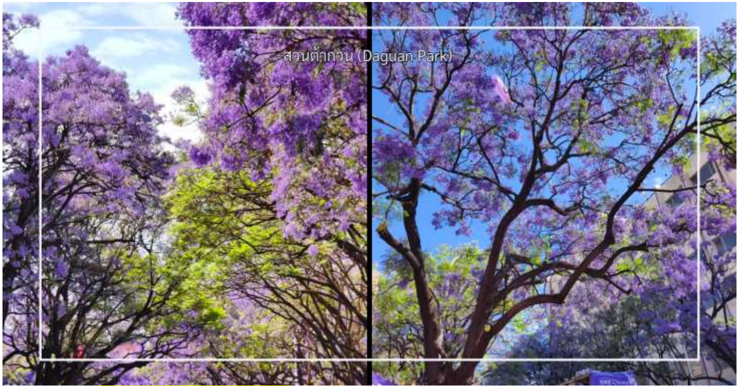
สวนต้ากวน (Daguan Park)