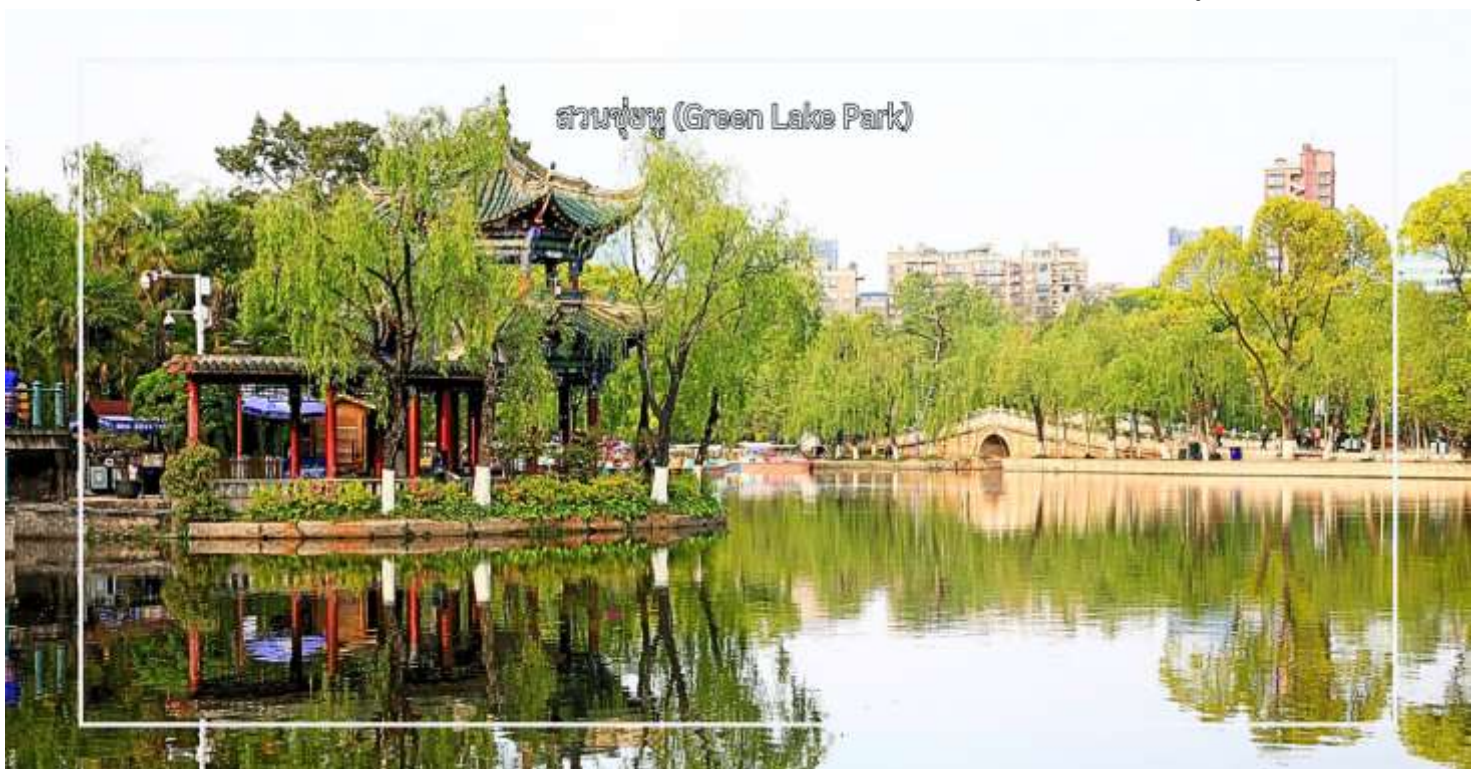
สวนชู่หู (Green Lake Park)

จากนั้นนำท่าน ชมทัศนียภาพ สวนชู่หู (Green Lake Park) เป็นสวนสาธารณะใจกลางเมืองคุนหมิงที่มีชื่อเสียงและได้รับความนิยมอย่างมาก โดดเด่นด้วยทะเลสาบสีเขียวมรกตที่โอบล้อมด้วยต้นไม้ร่มรื่น และบรรยากาศผ่อนคลาย เหมาะแก่การพักผ่อนและเดินเล่น สวนแห่งนี้เป็นศูนย์รวมวิถีชีวิตของชาวคุนหมิง นักท่องเที่ยวสามารถชมกิจกรรมท้องถิ่น สัมผัสบรรยากาศธรรมชาติ และถ่ายภาพความสวยงามของสวนในทุกฤดูกาล