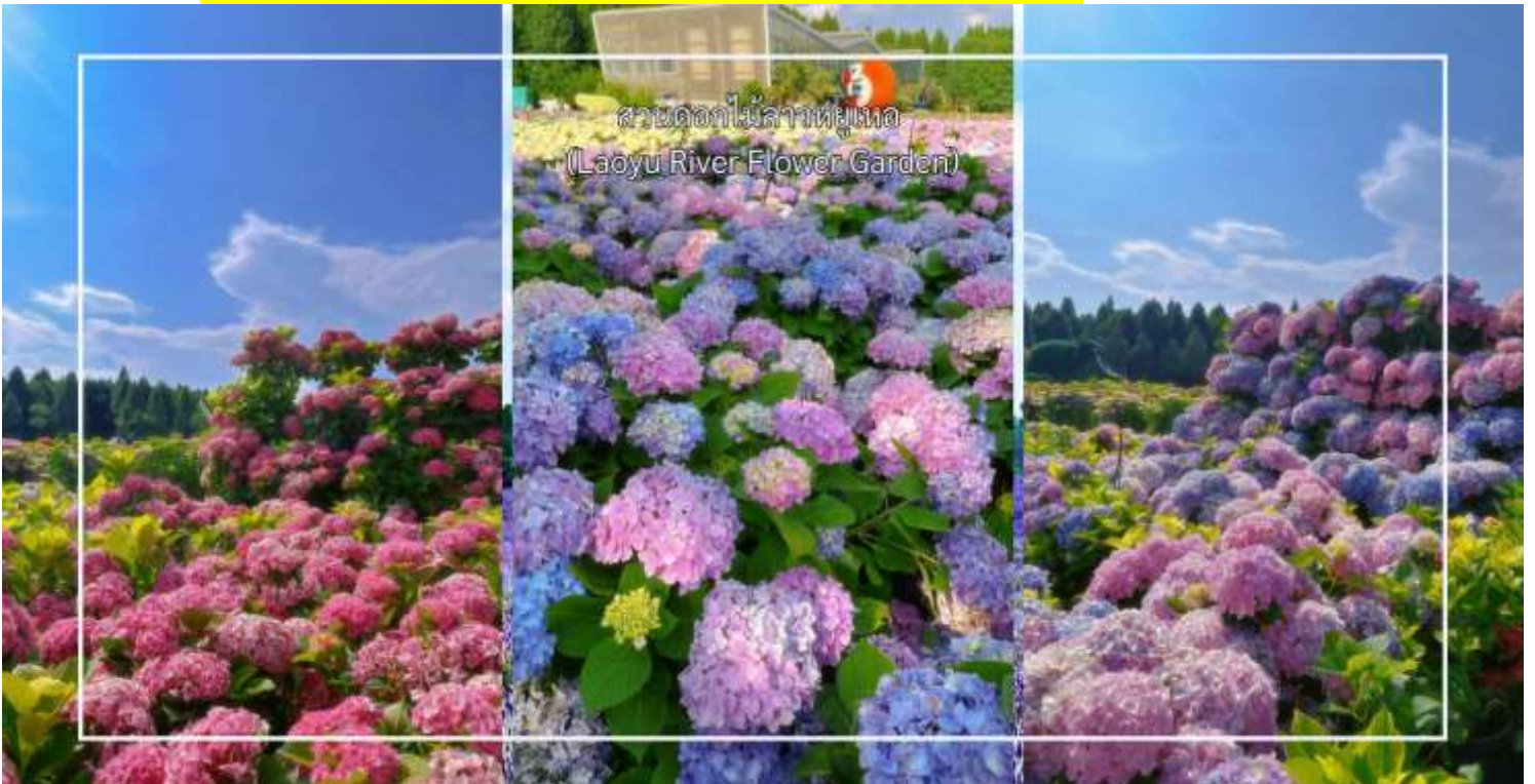
สวนดอกไม้ลาวยูเหอ (Laoyu River Flower Garden)

หมายเหตุ : การออกดอกของดอกไม้ในโปรแกรมท่องเที่ยวอาจแตกต่างกันไปในแต่ละช่วงเวลา ทั้งนี้ขึ้นอยู่กับสภาพอากาศและสภาพภูมิประเทศของพื้นที่ ณ วันเดินทางจริง ดอกไม้อาจยังไม่บานเต็มที่หรืออาจร่วงโรยแล้วทางบริษัทฯ ไม่สามารถการันตีการออกดอกหรือความสวยงามของดอกไม้ได้