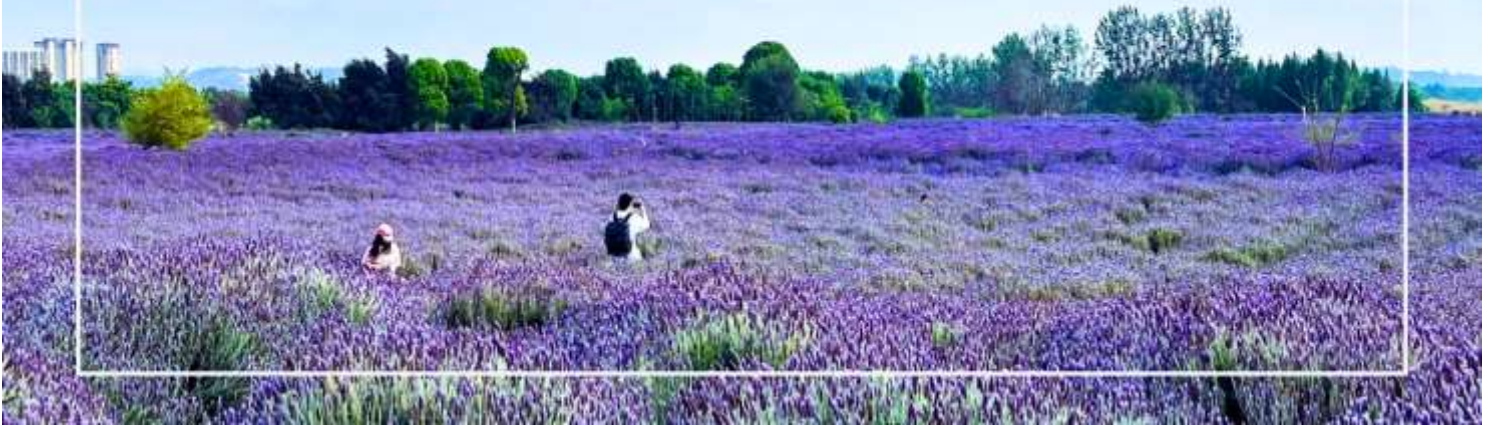
สวนดอกไม้ลาวยูเหอ (Laoyu River Flower Garden)