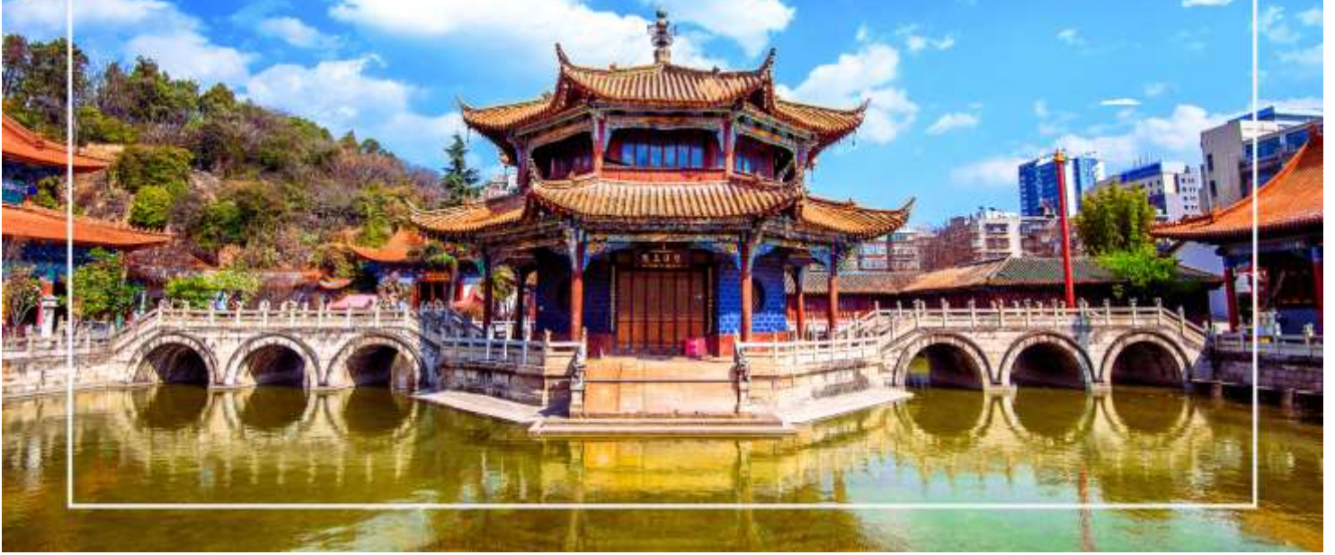
วัดหยวนตง (Yuantong Temple)