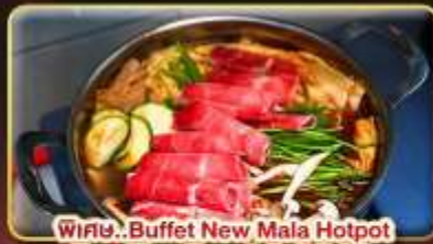
พิเศษ.. Buffet New Mala Hotpot Free Flow Beer & Soft Drink