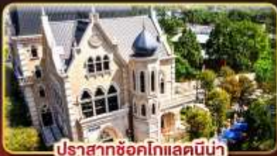
ปราสาทช็อคโกแลตมิน่า