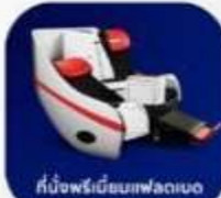
ที่นั่งพรีเมียมเฟลตเบด

บริการอาหารร้อน และ น้ำดื่ม บนเครื่อง ขาไป และ ขากลับ