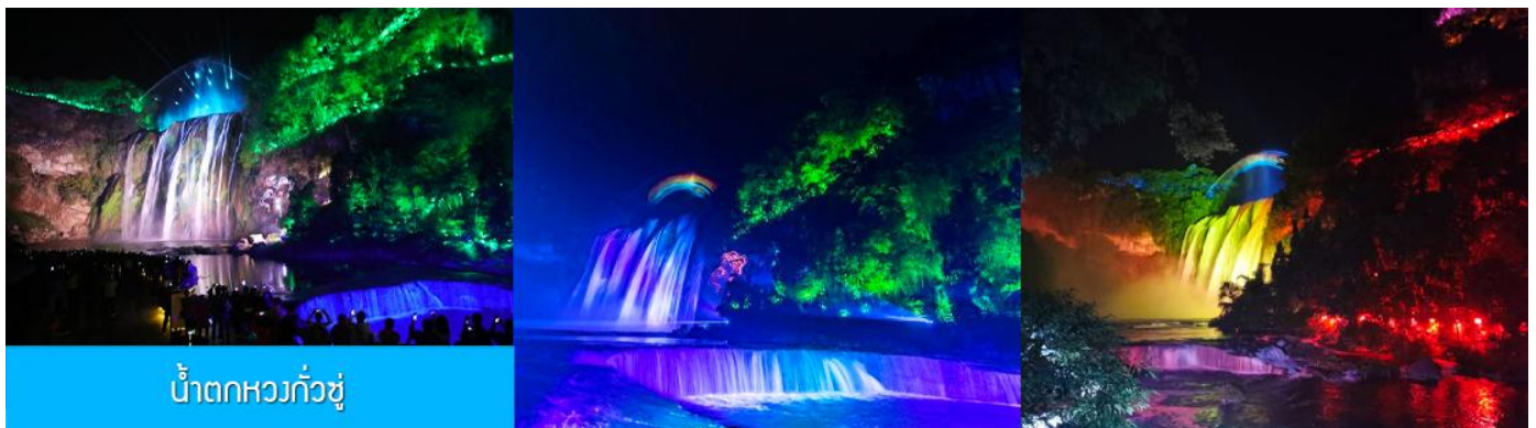
น้ำตกหวงกั๋วซู

รับประทานอาหารเย็น ณ ภัตตาคาร (มื้อที่ 6)